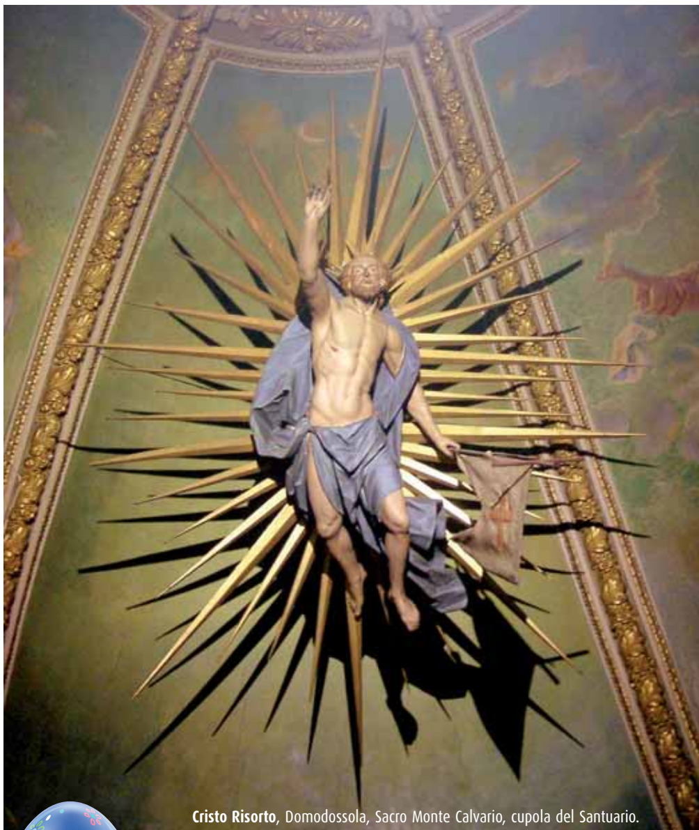
Cristo Risorto, Domodossola, Sacro Monte Calvario, cupola del Santuario.